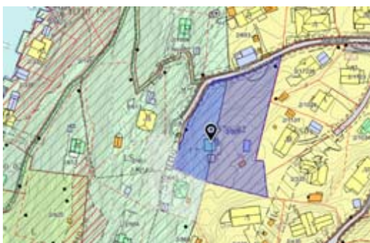
Bilde til venstre: Maristien 10, gårds- og bruksnummer 2/305

I tillegg skal det utredes om hensynssonen for bevaring H570 kan fjernes og formålet endres fra kombinert formål – bolig/fritidsbebyggelse (BAA) til boligbebyggelse-frittliggende småhusbebyggelse (BFS) for følgende eiendommer.