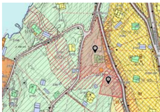
Bilde til høyre: Vardeveien 25 – gårds- og bruksnummer 2/191,206,337

I tillegg skal det utredes om hensynssonen for bevaring H570 kan fjernes og formålet endres fra kombinert formål – bolig/fritidsbebyggelse (BAA) til boligbebyggelse-frittliggende småhusbebyggelse (BFS) for følgende eiendommer.