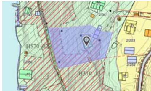
Bilde til høyre: Trollkleiva 12 – gårds- og bruksnummer 2/324