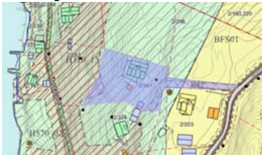
Bilde til venstre: Trollkleiva 10 - gårds- og bruksnummer 2/341

Vedtaket sier at det skal utredes om følgende eiendommer kan brukesendres fra fritidsbolig til helårsbolig: