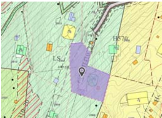
Bilde til venstre: Maristien 12 - gårds- og bruksnummer 2/640