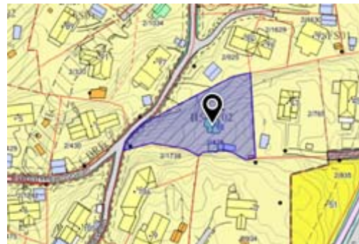
Bilde til høyre: Vardeveien 98, gårds- og bruksnummer 2/428